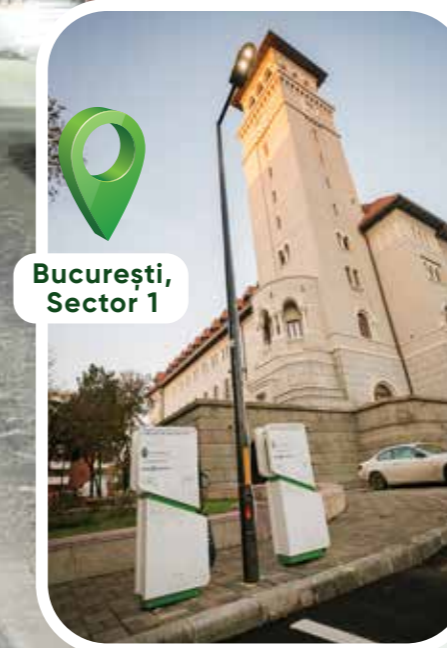
București, Sector 1