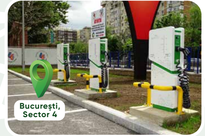
București, Sector 4